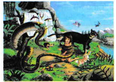
c. Șarpele Kaa este viclean.

6. Colorează casetele care conțin sentimentele/emoțiile/stările pe care le trăiește Mowgli în următoarele situații, așa cum reies din text.