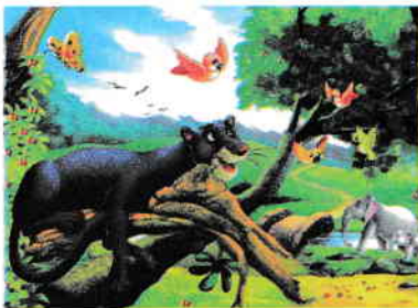
a. Baghera este grijuliu.

5. Motivează, prin cuvinte proprii sau prin scurte citate, însușirile personajelor ilustrate.